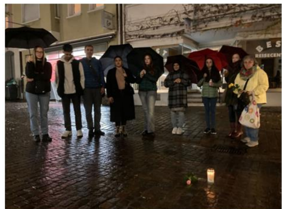
Stolperstein-Pat*innen aus der Tegginger-Schule